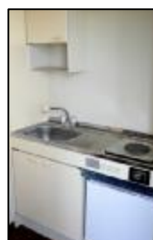
(電気コンロ) キッチン