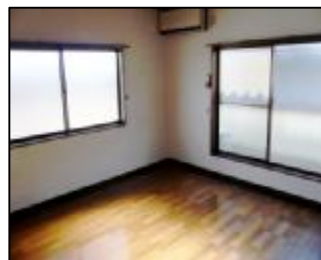
(2F 洋室) (ベランダ付)