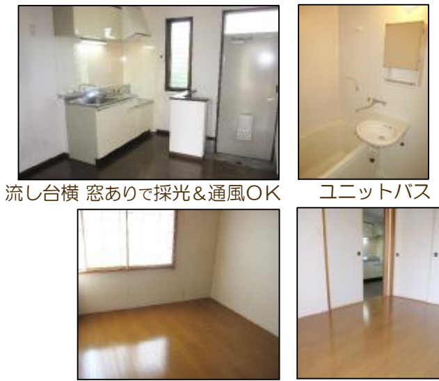
1階部洋室：フローリング貼りにリフォーム済み