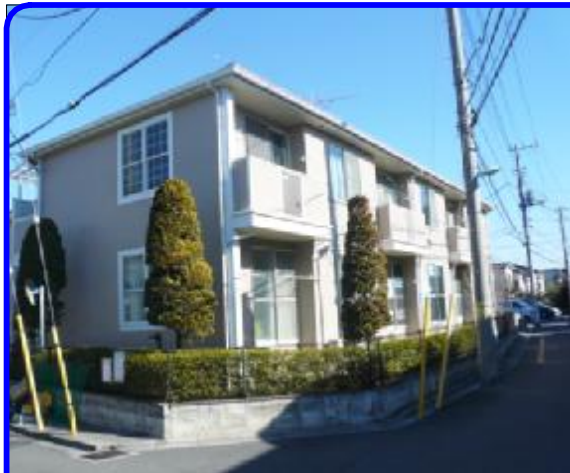
道路面角地で陽当たり良好です