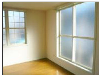
白を基調とした洋室! 角部屋2面採光ありで明るい室内

~* 周辺 *~ ★コンビニ...500m&820m ★スーパー(マルエツ)...1000m (ヤオコー)...970m ★ドラッグストア...720m&600m2ヶ所あり ★埼大通り沿1000m範囲内にファミレス・ファーストフード店あり