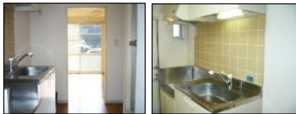
陽当り良好、明るい室内です。(110号室角部屋写真)