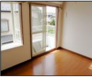
陽当り良好(参考写真) DK7帖