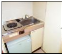
キッチン2帖参考写真 電気コンロ(1口)