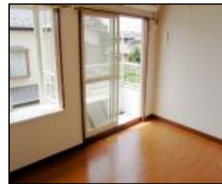
陽当り良好(参考写真)DK7帖