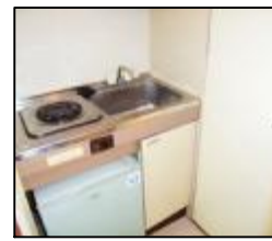
キッチン2帖参考写真 電気コンロ(1口)