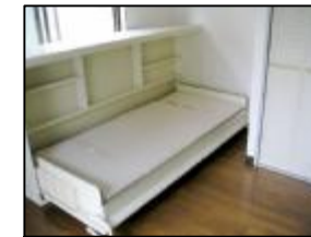
お部屋が広く使える 収納ベット 2面採光です。