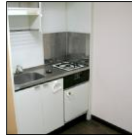
一口ガスコンロ付 ミニキッチン