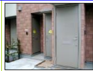
アメリカンタイプの玄関