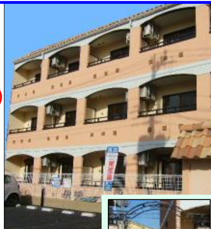
南ヨーロッパをイメージしたおしゃれな外観