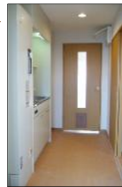
キッチン2.5帖 室内扉にはペット出入口扉付