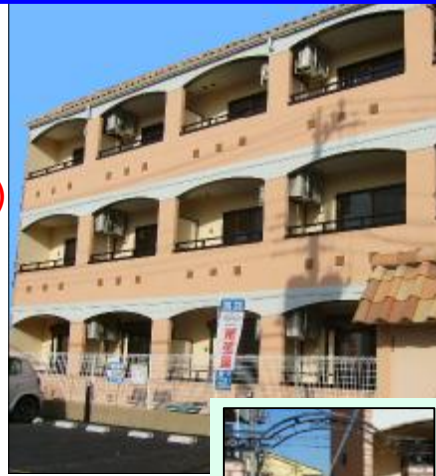
南ヨーロッパをイメージしたおしゃれな外観