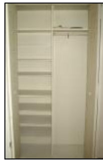
廊下 使いやすい 物入収納