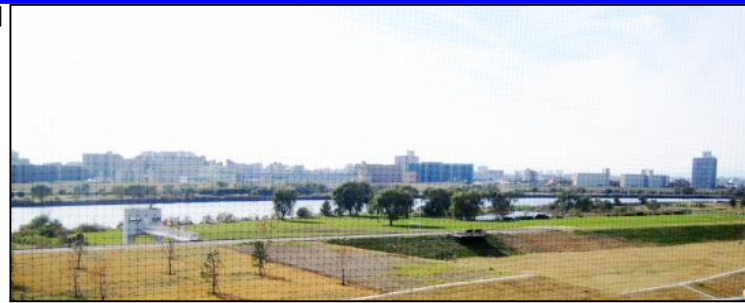
705号室 荒川河川敷が一望! バルコニからの眺望です

※図面と現況が相違する場合は、現況を優先いたします。 ※万一契約済の際は、あらかじめご了承ください。