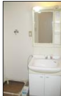
シャワー水栓付 洗面化粧台