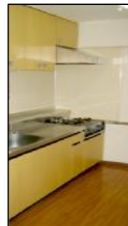
独立型キッチン LDがスッキリ 使えます。