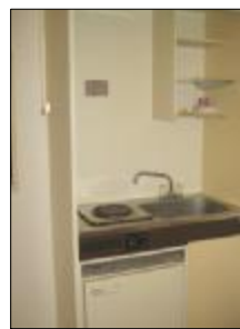
電気コンロ(1口) ミニ冷蔵庫付