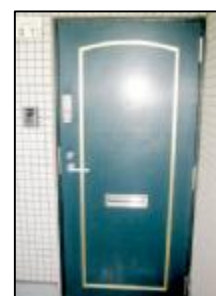
TVインターホン 暗証番号式補助錠あり