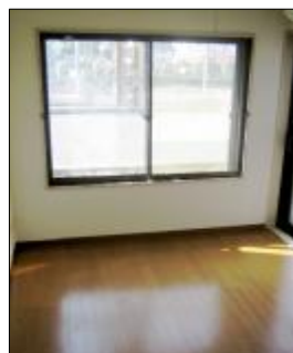
明るい室内、防音にも 配慮した、二重サッシです