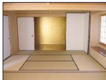
和室2間続きで緑豊かな庭園をみはらせる高級感のある和室