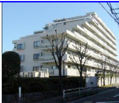
2面道路で陽当り良好です

※鍵の交換入居者負担 ※退居時、指定業者による、クリーニング費用を負担して頂きます。