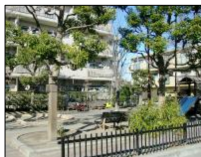
マンション 隣の西南公園