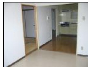
DK・洋室6.5帖 続き間で利用でき、

※図面と現況が相違する場合は、現況を優先いたします。南面コーナー窓ありひろびろ、明るくLDKで利用できます