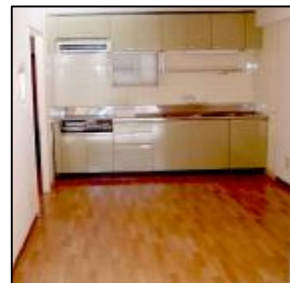
IHクッキングヒーター付のキッチンセット2シンクです