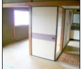
2階居室2面採光あり明るい室内です