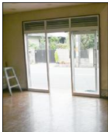
1階部分店舗・事務所