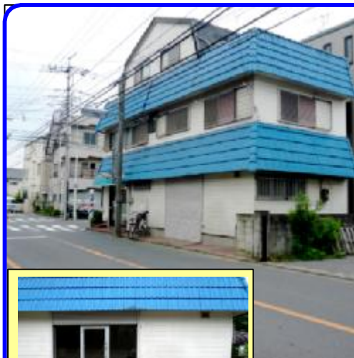
別所地区の閑静な住宅街西側道路です