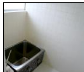
1階浴室、窓ありで採光・通風が取れます