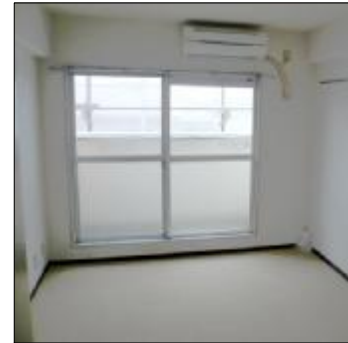
《室内参考写真》 エアコン付き明るい室内