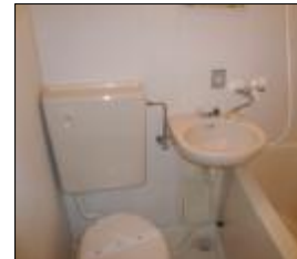
3点ユニットバス (反転タイプ)