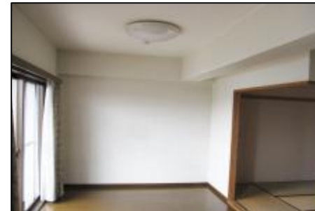
バルコニー面 和室戸襖を開口し 広々明るいLDKで利用できます