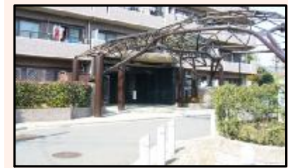
アルトラスドームが訪れる人を優雅に迎えます。