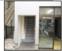
↑事務所・住居入口