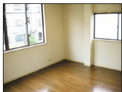
南道路面採光あり