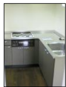
←トイレ内洗面台 →家事動作が便利な L形キッチン