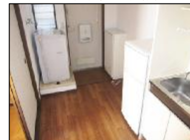
K：洗濯機・冷蔵庫付き