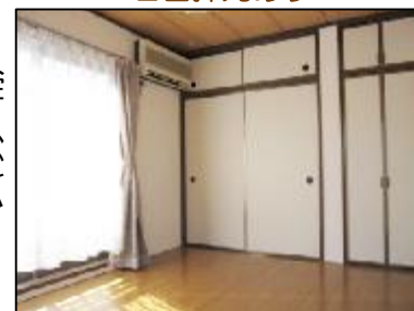
物入(天袋付)で収納多し