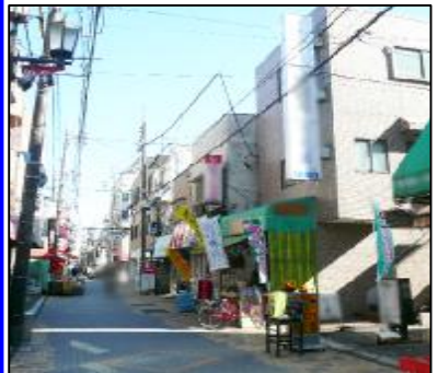
建物前商店街風景