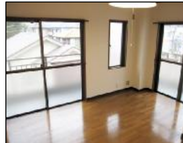
2面バルコニー2面採光あり 明るい室内です