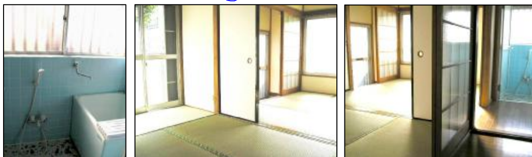
浴室:窓有で採光&通風もOK 和室2間続きで、ひろびろ利用できます。