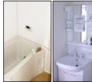
追い炊付 シャワー水栓付