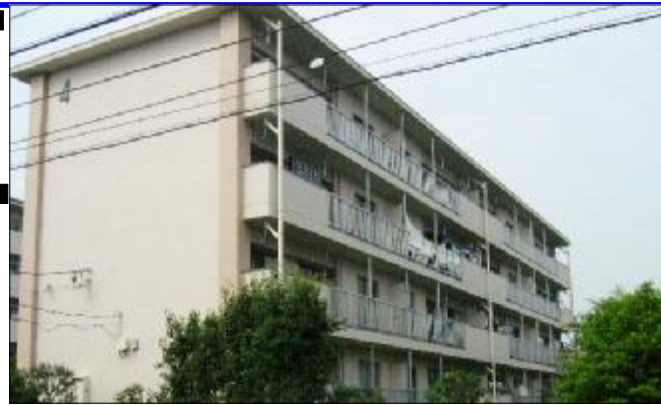
緑の多い 浦和栄和団地 (写真は4号棟です)

※図面と現況が相違する場合は、現況を優先いたします。 ※万一契約済の際は、あらかじめご了承ください。