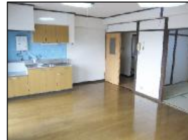
1間半の押入天袋付きあり