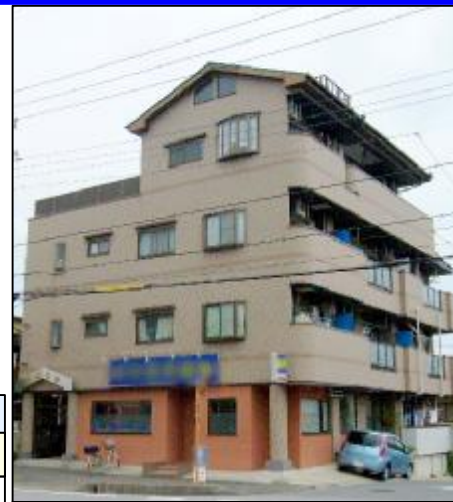
タイル貼りにリニューアルしました ベランダ面は道路です。