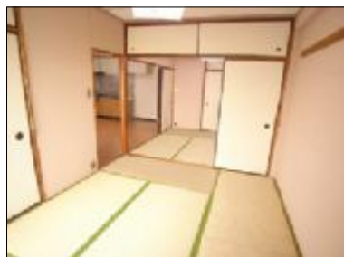
LDK・和室 各部屋開口でき ひろびろ利用できます