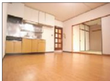
LDKひろびろ利用できます