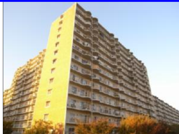
国道17号線沿いで交通の便よし

※鍵の交換入居者負担 ※退居時、指定業者による、クリーニング費用を負担して頂きます。